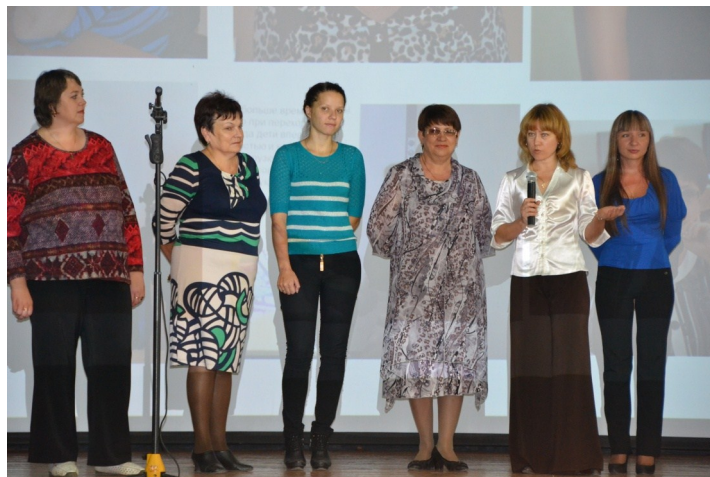
Кураторы групп нового набора

ха, паутина, каляки-маляки (мы рисовали портрет своего куратора), давали студенческую клятву, стоя коленями на горохе, танцевали и пели всей группой. Так же был конкурс, где нужно было ртом достать дверной ключ из тарелки с мукой. Всем группам нового набора было очень азартно участвовать в данном мероприятии. Было здорово!