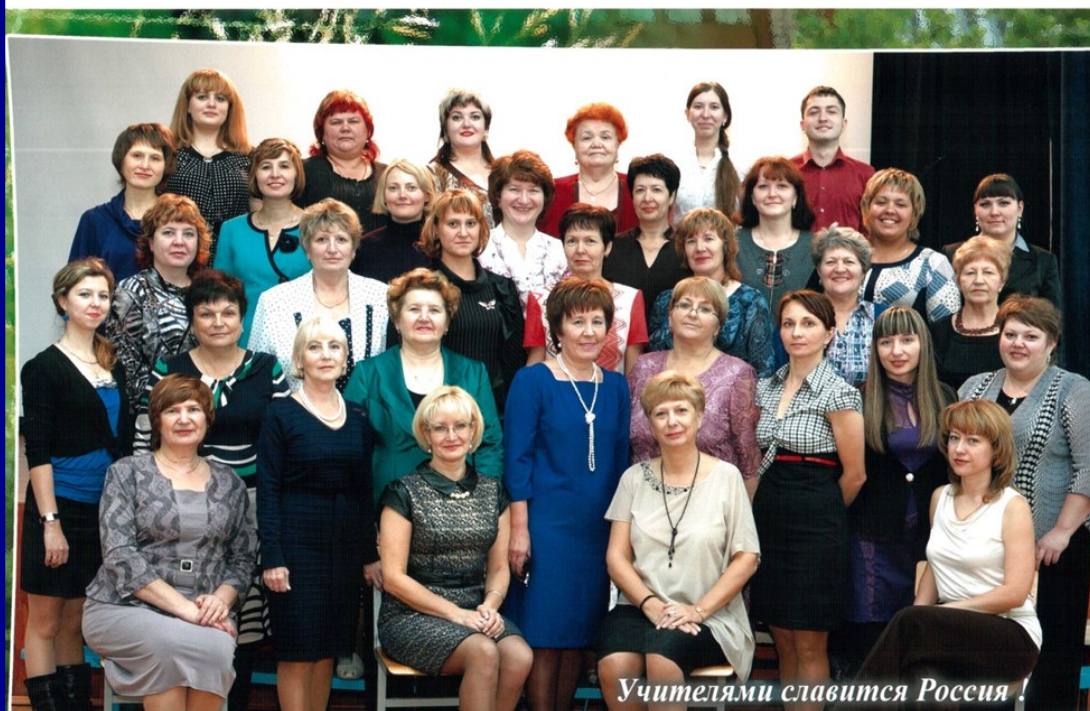
Учителями славится Россия!